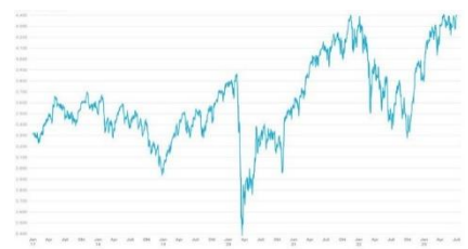
Euro Stoxx 50